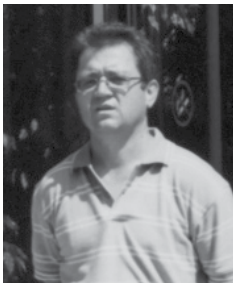
por Joaquim Igreja