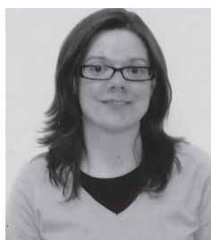
por Marlene Gonçalves

“O Natal é a solenidade cristã que celebra o nascimento de Jesus Cristo. A data para a sua celebração é o dia 25 de Dezembro, pela Igreja Católica Romana (...) Ainda sendo uma festa cristã, é encarada universalmente por pessoas dos diversos credos como o dia consagrado à reunião da família, à paz, à fraternidade e a solidariedade entre os homens.” (in Wikipédia Português).